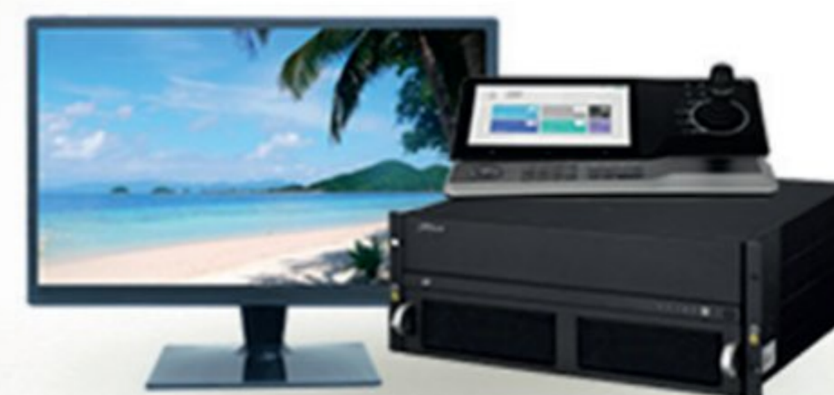
AFFICHAGE ET CONTROL